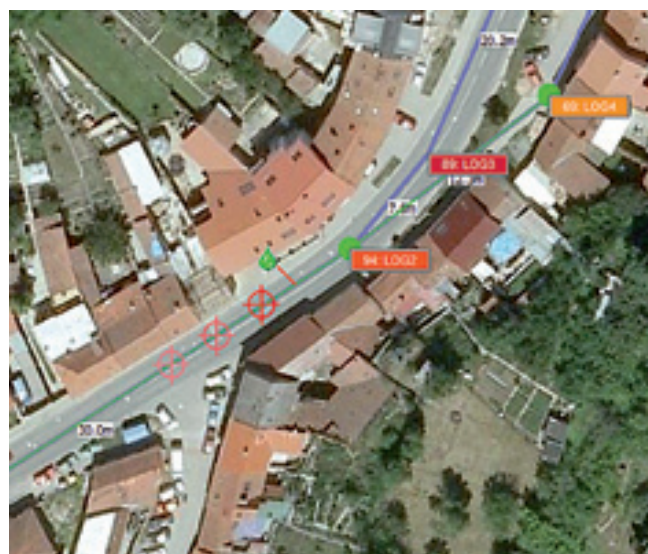
Der Leck-Navigator führt den Anwender per GPS direkt zum Ort der Leckage.