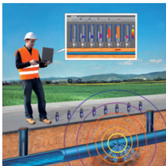
Die Punktortung zeigt an unter welchem Sensor die Leckage ist.