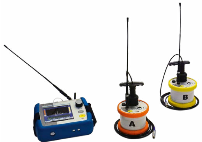
Powertransmitter (Sender & Mikrofon)

Um die Betriebsdauer vom Powertransmitter zu maximieren, wird der Funk erst aktiviert, sobald der Sensor vom Powertransmitter genommen wird.