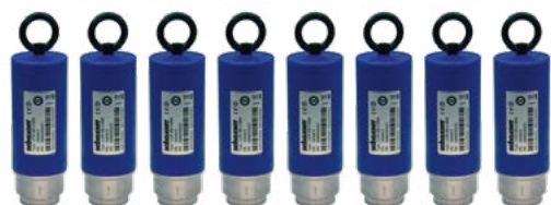
Offline-Messung mit bis zu 8 Multisensoren