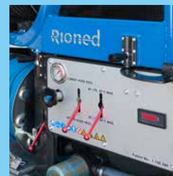
Option Heißwasser bis 85°C