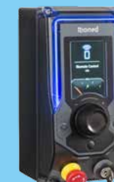
eControl+ Anzeige (in Kombination mit RioMote Fernbedienung)