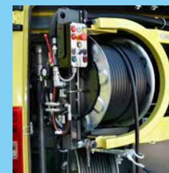
Schwenkbar und drehbar Hochdruckhaspel