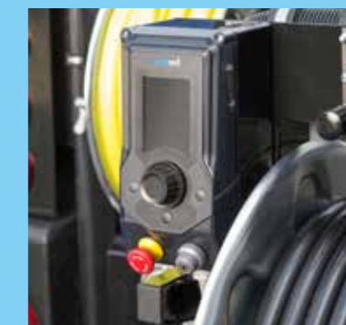
eControl+ Anzeige (in Kombination mit RioMote Fernbedienung)