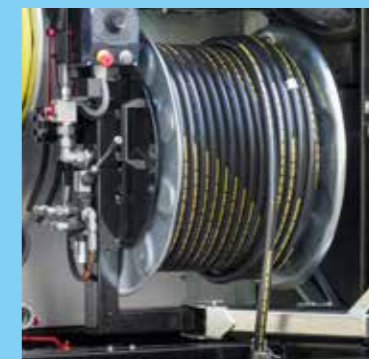
um 90° + 180° schwenkbare Hochdruckhaspel