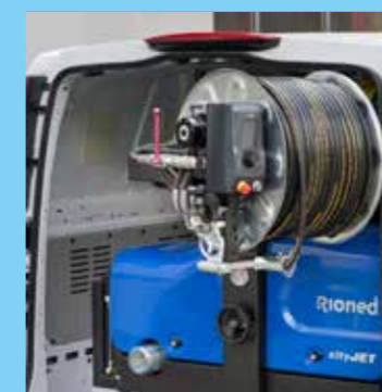
Um 180° schwenkbare Hochdruckhaspel für maximal 140 Meter 1/2" Schlauch