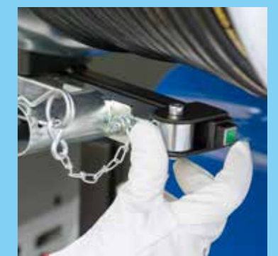
Standard elektrische Arretierung der Haspel macht schwenken einfach

VERSCHAFFEN SIE SICH AUF WWW.RIONED.COM EINEN EINDRUCK