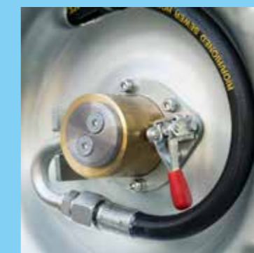
Standard mechanischer Freilauf auf Haspel für Abrollen ohne Widerstand